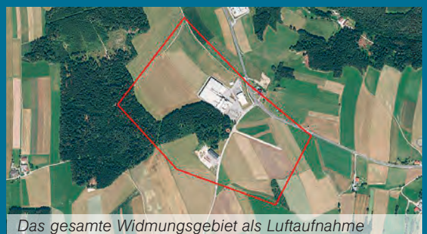
Das gesamte Widmungsgebiet als Luftaufnahme