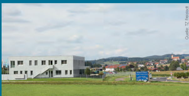
Betriebsgebiet Rainbach i. Mkr.