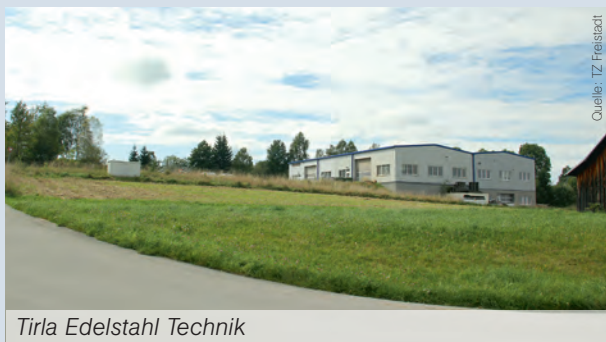
Tirla Edelstahl Technik