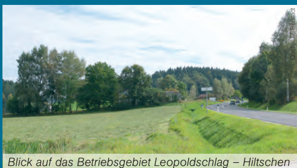
Blick auf das Betriebsgebiet Leopoldschlag – Hiltchen