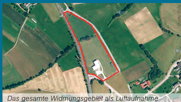
Das gesamte Widmungsgebiet als Luftaufnahme